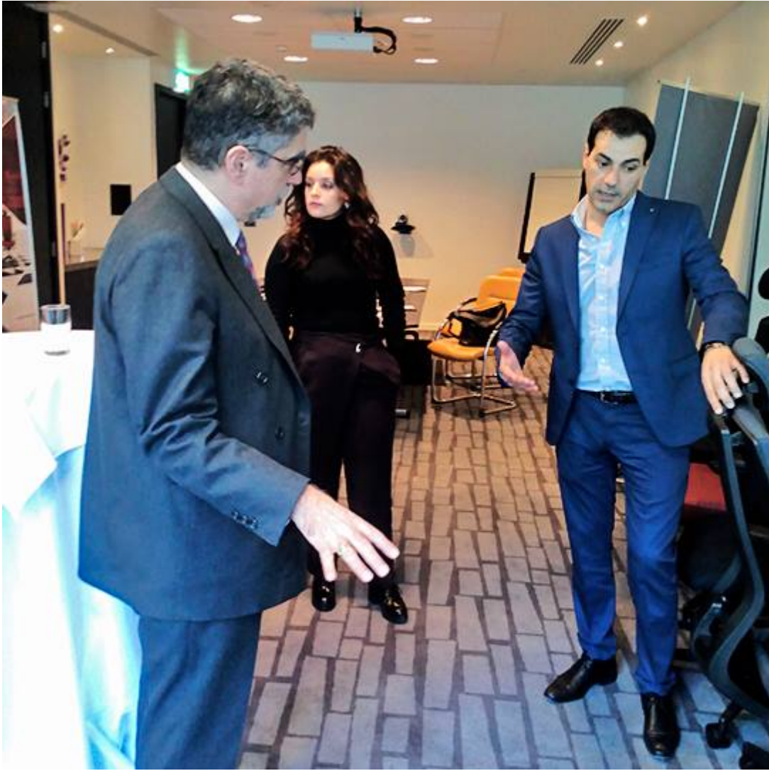
Figura 1: Apresentação de produtos Cadeinor na R. da Irlanda