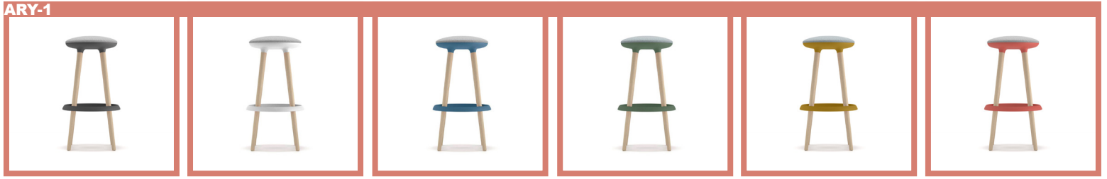
P0G - Dark Grey