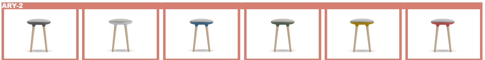
P0G - Dark Grey